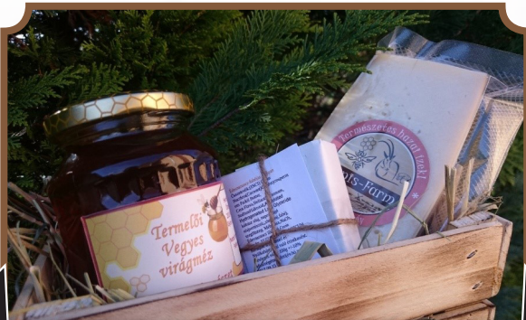
Apis Farm- Piliscsév

A Dorog és Térsége Turizmus Egyesület összeállított egy olyan termékpalettát, amelyet szívesen ajánl az Ön figyelmébe.