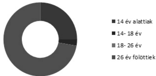
Tanulással, képzéssel töltött alkalom

Információt összesen 4 alkalommal kértek tőlünk (buszmenetrend, nyitva tartások), tanácsadások és irodai szolgáltatások 3-3 alkalommal fordultak elő (fénymásolás, szkennelés), ügyintézésben 2 alkalommal segítettünk (anyasági támogatás igénylése, üdülési pályázat benyújtása).